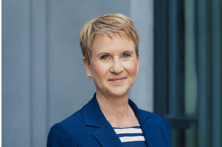
Dr. h.c. Susanne Klatten München