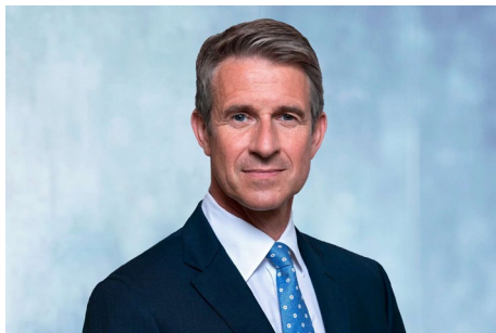
Stefan Quandt Bad Homburg v. d. Höhe