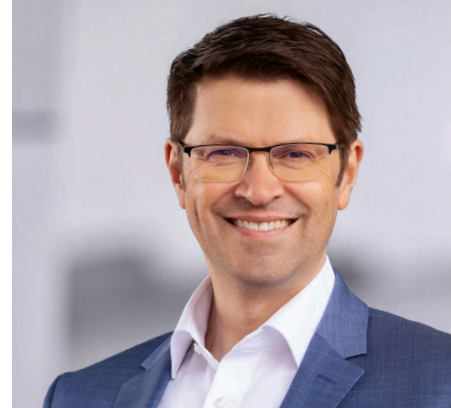
Oliver Zipse Vorsitzender des Vorstands der BMW AG